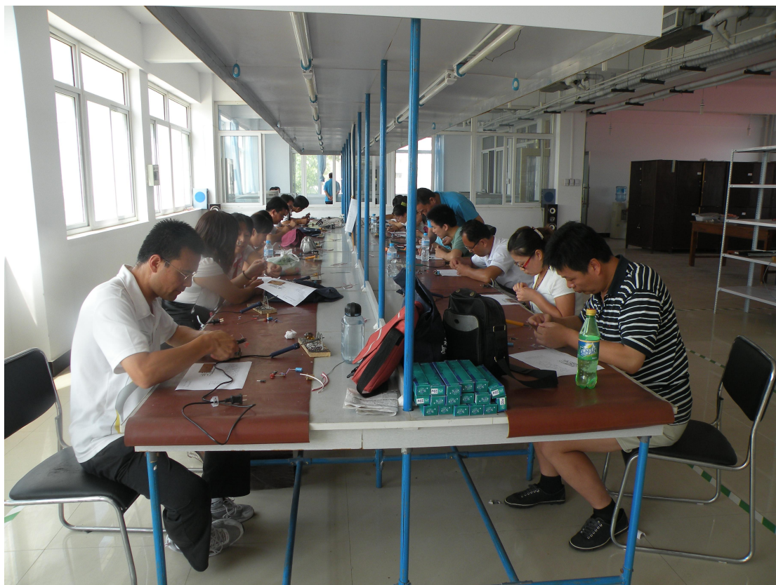
“河北省职业技术中学电子专业教师培训班” 依托该基地完成一周的企业实践